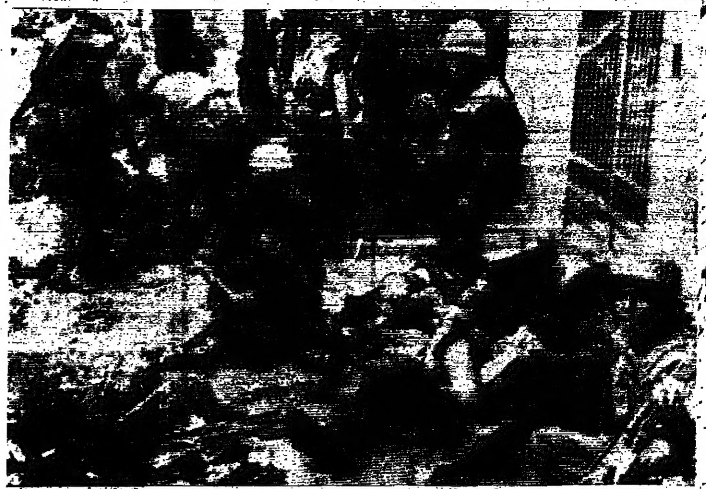
مشاة البحرية الأمريكية في مينيسوتي الجنوبية يمشون جراحهم خلال المعركة الضارية التي نشبت في العاصمة الإمبراطورية الصينية «تشنج» (تشنج المينغونج)